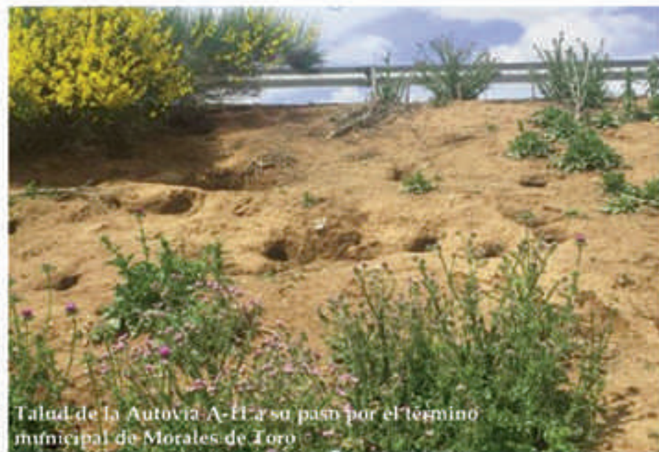
Talud de la Autovía A-11 a su paso por el término municipal de Morales de Toro

Por si no fuere suficiente, la Ley de Caza de Castilla y León considera zonas de seguridad a las vías y caminos de uso público y sus márgenes. El control poblacional de conejos no puede reali-