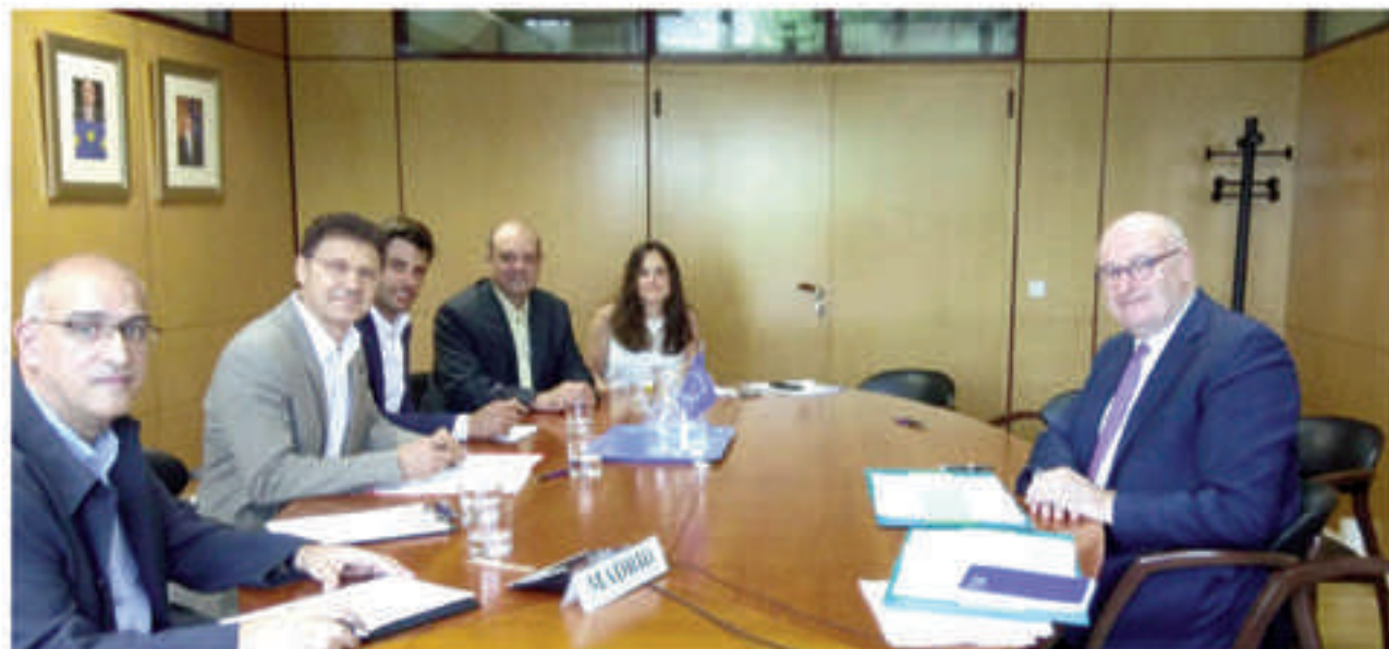
CUMBRE/REUNIÓN BILATERAL DE LOS RESPONSABLES DE NUESTRA ORGANIZACIÓN CON EL COMISARIO DE AGRICULTURA.