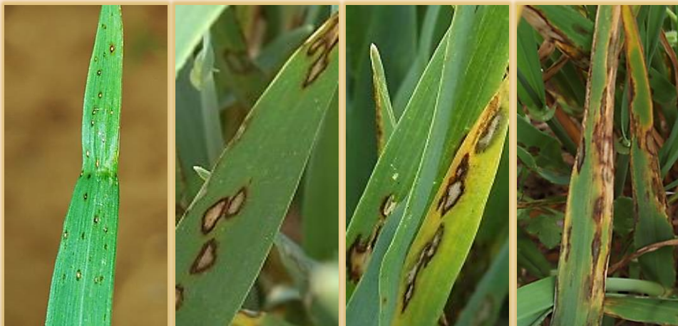
Evolución de la expresión de las manchas en hoja