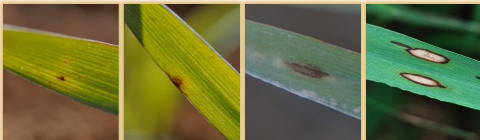
Evolución de las manchas

Muy común en Castilla y León, ocurre con relativa asiduidad. Sin embargo, sólo si se superan los umbrales de tratamiento puede constituir un problema significativo.